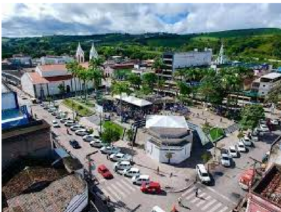
Vista Aerea da Praça central “ Dr. Paulo Paranhos”

A contratação de empresa para realização do show da Banda FELIPÃO & FORRO MORAL terá objetivo de atrair muitos admiradores , sendo uma das bandas que sempre se destaca no cenário musical, levando muita qualidade , profissionalismo e música boa para o seu público.